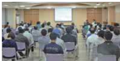
西郷地区で行われた説明会の様子

庁舎の耐震性及び老朽化による課題などを、役場内で検討した結果について説明する庁舎整備計画説明会を5月19日から6月2日まで町内8地区で行いました。