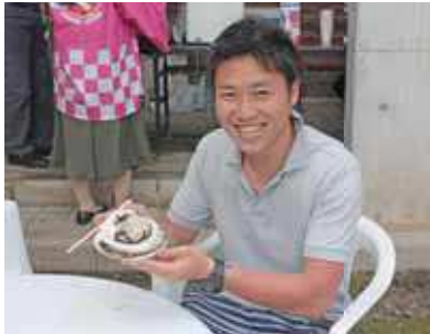
横浜市から来た観光客の方が、立ち寄ってくれました。「こんなに大きい牡蠣は、今まで食べたことない」と感動していました。