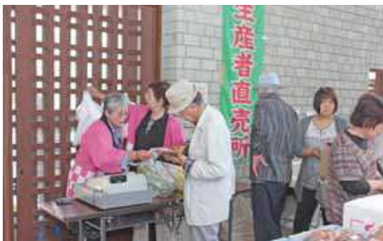
ボランティアスタッフの方々が接客をしています。

5月28日に開催された幸市場の様子です。この日は、同日開催された、「島後小学校陸上競技大会」のためか、いつもより人が少なめでしたが、新鮮な野菜や魚介類などを目当てに来た人でにぎわっていました。