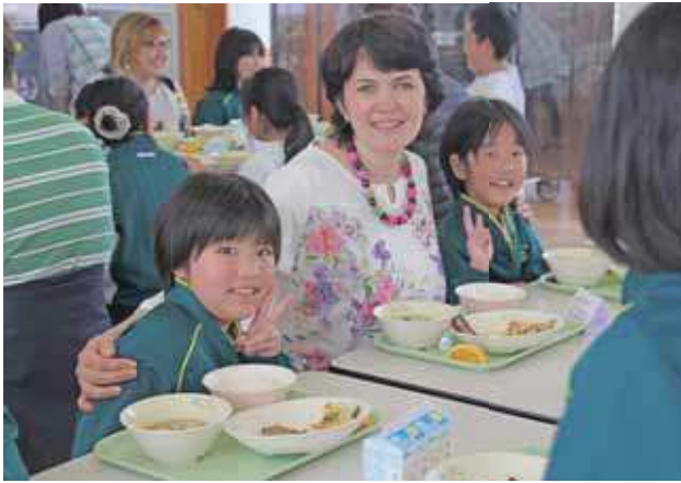
給食と一緒に食べる様子

訪問団は、「とても美しい島。子どもたちは、笑顔と目が輝いていて素敵だった。」と感想を話しました。