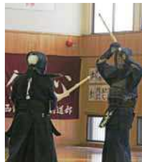
70歳以上の部、決勝戦の様子