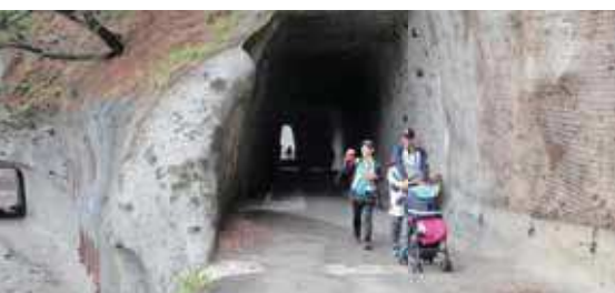
ベビーカーを押して歩く方もいました（福浦トンネル）

参加者の皆さんからは、「おもてなしに感謝しています。ジオパークにふさわしい素晴らしい自然でした。」とお言葉をいただきました。