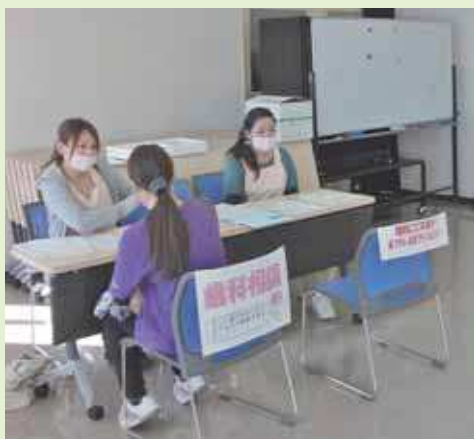
歯科検診での歯科相談の様子

歯周病の予防のためには、原因となる歯垢（プラーク）の除去が大切です。自分では、丁寧に歯磨きをしていても、どうしても磨き残しがあります。特に、奥歯や歯並びの悪い箇所には、歯垢（プラーク）が残りやすいとされています。歯茎の中など、自分の歯磨きだけでは取り除くことのできない汚れもあります。このような汚れは、歯科医院でのお手入れが欠かせません。かかりつけ歯科医をもち、定期的な受診して、大切な歯を守りましょう。