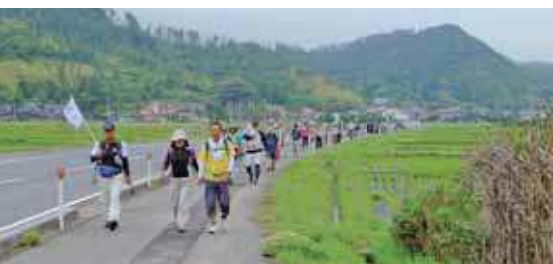
田植え後の水田を眺めながら歩く参加者の皆さん

隠岐を3日間かけて歩く「とって隠岐スリーデーウォーク」の3日目は、五箇地区で行われ、約70名の参加者の皆さんは、青い海や新緑の中を歩きました。