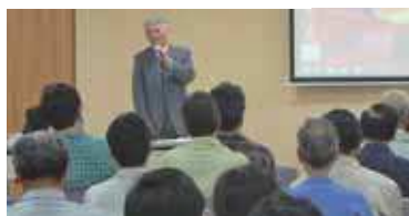
あいさつをする松田町長

この説明会でのみなさまのご意見をもとに、今後の庁舎整備の方針を決めていきたいと考えております。説明会の様子を広く町民のみなさまに知っていただくため、説明会の資料、質疑の内容を冊子にし、本庁、支所、出張所及び隠岐の島町図書館に置いてあります。また、役場ホームページでも公開しています。