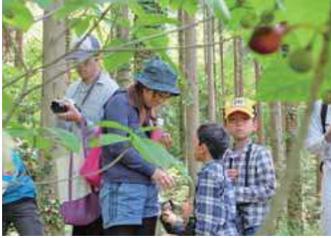
珍しい木の実を手にとり、中を覗く親子連れ