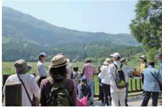
展望台から池を眺める参加者の皆さん。ガイドの方によると、油井の池は地滑りでできた池で、38種類のトンボが生息しているそうです。

環境省自然保護官事務所による自然観察会が、油井の池園地で行われ、16名の参加者の皆さんは、ジオツアーガイドの案内で自然観察を満喫しました。