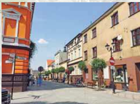
写真右：クロトシン市の協会 写真左：クロトシン市の町並み (いずれも、ポーランド・オープンに町力士が出場したときに撮影)

主要産業は、農業で、穀物や植物種子などを多く産出しています。古くからレスリングなど格闘技を中心としたスポーツが盛んで、ポーランド相撲連盟の本部が置かれています。