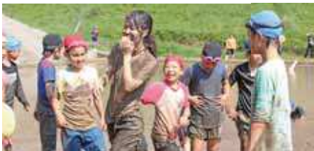
田んぼに落とされた先生

有木小学校5、6年生の児童23名により、有木地区の水田でどろんこ運動会が行われました。アメ食い競争や綱引きなどの競技を行い、子どもたちは、元氣よく活動しました。 子どもたちは、「泥はぬるぬるしていたけど楽しかった。先生を落としたのが一番面白かった。」と満足した様子でした。