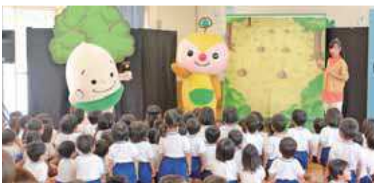
森づくりキャラクターショーの様子（隠岐共生学園第二保育所）