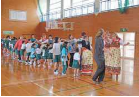
ロシアのゲームを楽しむ北小学校児童と訪問団

5日に西郷港に到着した訪問団は、ロシア人墓地を拝礼、献花し、福寿会や町長などと面談しました。