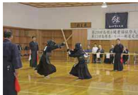
鋭い打ち込みを見せる出場者