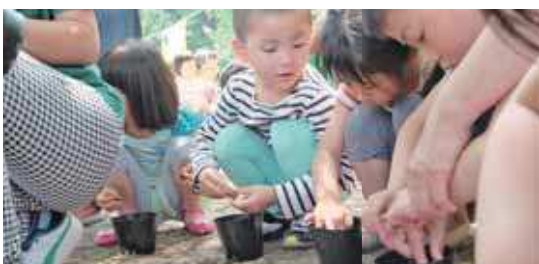
どんぐりを植える園児たち（原田認定こども園）