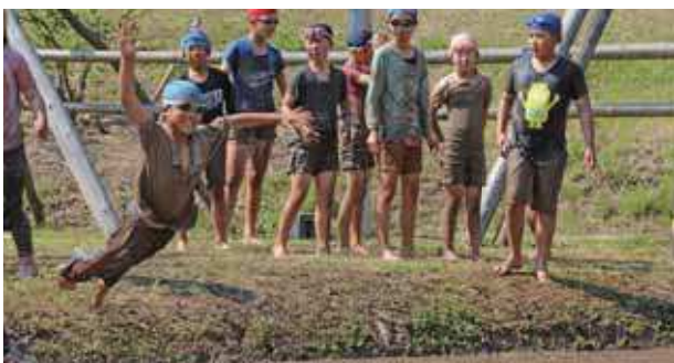
リレーで体から泥に飛び込む様子