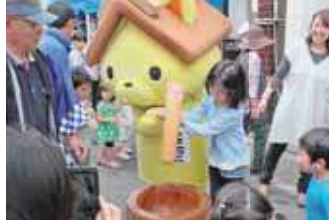
「しまねっこ」と餅つき