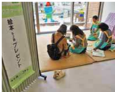
プレゼントされた絵本を 読み聞かせる様子