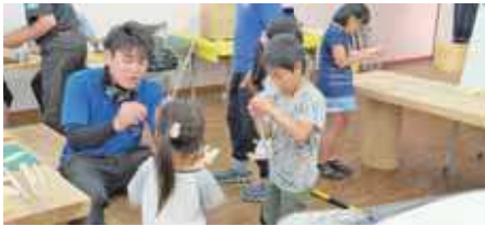
割り箸鉄砲作りに挑戦する子どもたち