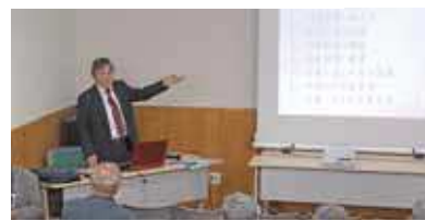
常角先生による講演の様子