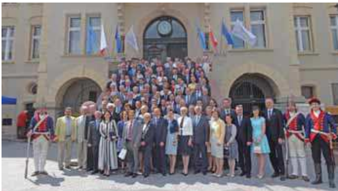
クロトシン市制600周年記念式典での集合写真

このことがきっかけで、平成27年3月3日、日本・ポーランド両国大使、クロトシン市長、ポーランド相撲連盟会長など、総勢10名の方が来島され、隠岐の島町執行部、議会と面会したのち、町力士の稽古を見学されました。