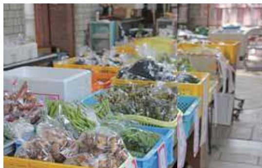
陳列された商品の一角。干椎茸、セリ、わらびなどが並んでいます。

この日は、やや暑かったのですが、玄関前がかき氷の無料配布が行われ、訪れた皆さんはかき氷を口にし、涼をとっていました。