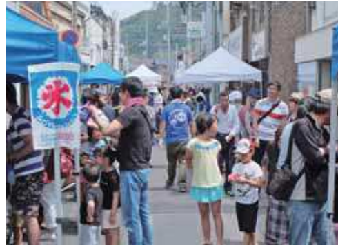
にぎわいをみせる目貫通り

隠岐若者100人委員会による中町目貫祭りが開催されました。大勢の親子連れなどが訪れ、フリーマーケットや「しまねっこ」との餅つきなどを楽しみました。