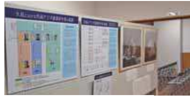
館内の展示スペースの様子